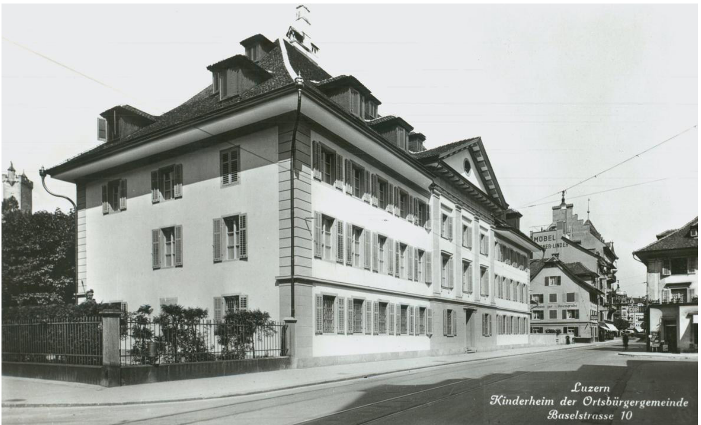
Ursprünglich stand das Waisenhaus an der Baselstrasse 10. Erbaut wurde es zwischen 1808 und 1811 von Josef Singer. In den 1970er-Jahren wich es dem Parkhaus Altstadt und wurde als Hülle für das Naturmuseum am Kasernenplatz rekonstruiert.

In den Turbulenzen des helvetischen Umschwungs (1798–1803) und der Mediation (1803–1813) behauptete sich Josef Singer als eine prägende Figur in der luzernischen Gesellschaft und später auch in der Politik. Eine wichtige Konstante war dabei seine Tätigkeit in der Zunft zu Safran. Nach seiner Rückkehr aus Frankreich trat er 1783 in die Zunft ein. Dort diente er von 1787 bis 1793 als Kerzenmeister, von 1793 bis 1799 als Stubenmeister, 1799 als Ad-